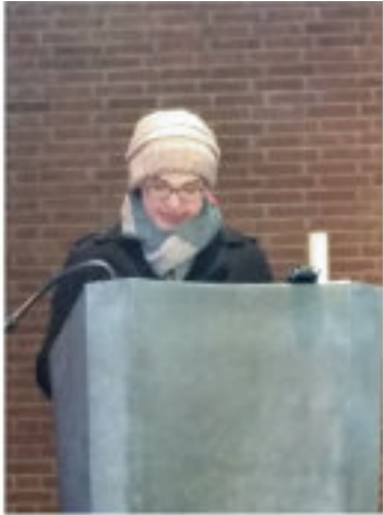
Audioaufnahme in der kalten Versöhnungskirche

Die Einführung feiern wir zu einem späteren Zeitpunkt, wenn wieder größere Feste möglich sind.