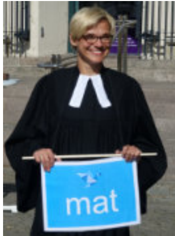
Beim Antikriegstag auf dem Markt